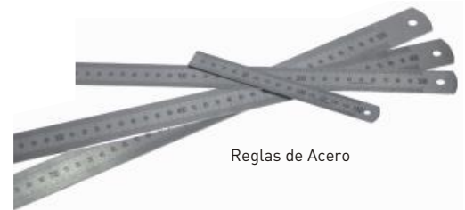
Reglas de Acero