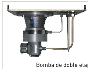
Bomba de doble etapa