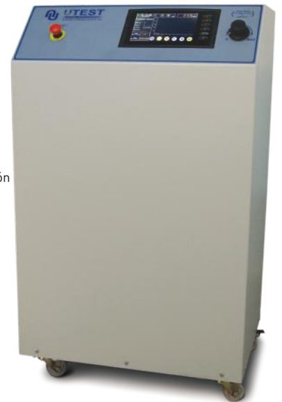
UTC - 4840