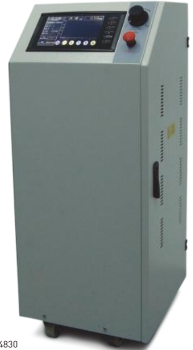
UTC - 4830