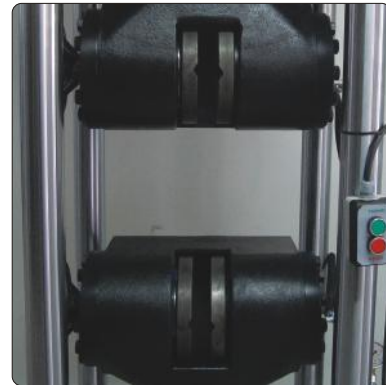
Gerilme testi için test mesafesi

Çeneler arası deney mesafesi motor sürücülü el tipi bir kumanda sistemi ile yapılabilir. Kullanıcı gövdenin dizaynı sayesinde hidrolik çenelere deney numunesini kolayca yerleştirebilir.