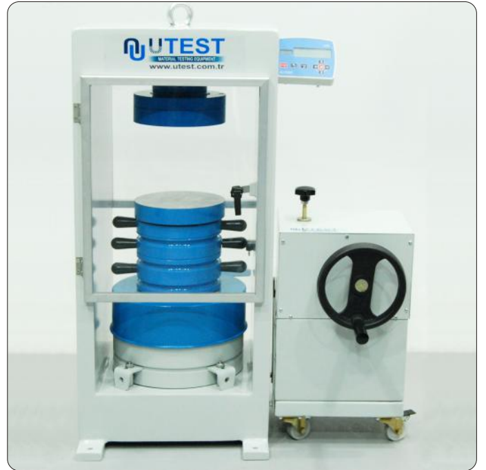
UTC - 4110

UTEST 600 kN and 1500 kN kapasiteli El Kumandalı Basınç Dayanım Deney Presleri, özellikle elektrik enerjisi sağlanamayan şantiyelerde, beton basınç dayanım deneylerinin yapılabilmesi amacı ile tasarlanmıştır. Güvenilir ve ekonomik çözüm sağlar.