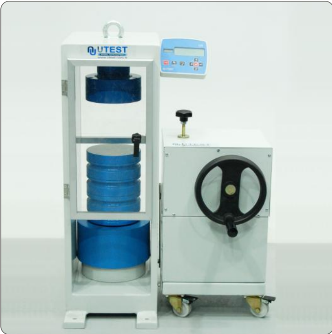
UTC - 4010